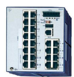
Power Over Ethernet

Con i nostri partner HUBER+SUHNER, Belden e Apem siamo in grado di fornire soluzioni ad hoc per qualsiasi applicazione Ferroviaria, CBTC, bordo macchina ma anche track side .