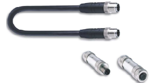
Connettori M12 Railway