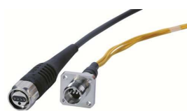
Connettori ODC Robusti