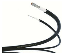
Cavi RADOX® EN