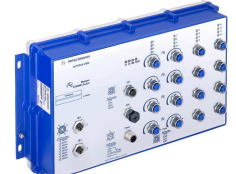
Octopus Gigabit Switch