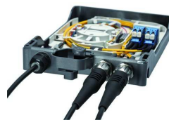
Sistemi di Fiber Management