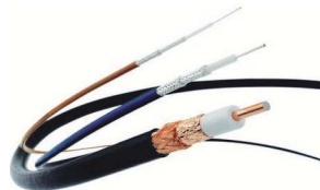
Cavi Coassiali Railway